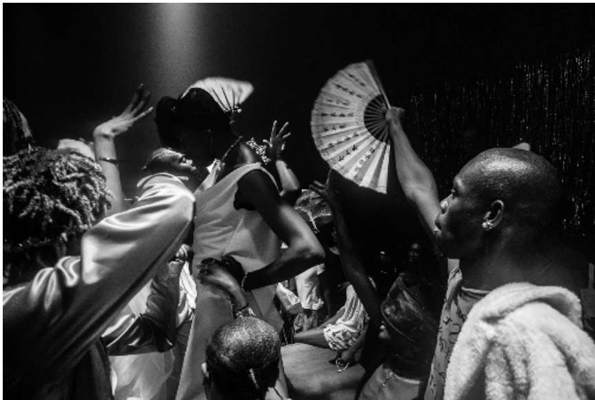
Les participant·e·s à Heavenly Bodies , un événement clandestin de drag ballroom organisé pendant la Fierté de Lagos, célèbrent la gagnante du titre de « mère de l'année ».

La représentation positive compte. Selon Action for Children, se voir représentés de façon authentique dans les médias aide les jeunes de la communauté LGBTQI+ à valider leurs expériences, favorisant une société dans laquelle chacun·e peut se sentir à l'aise d'être soi-même.